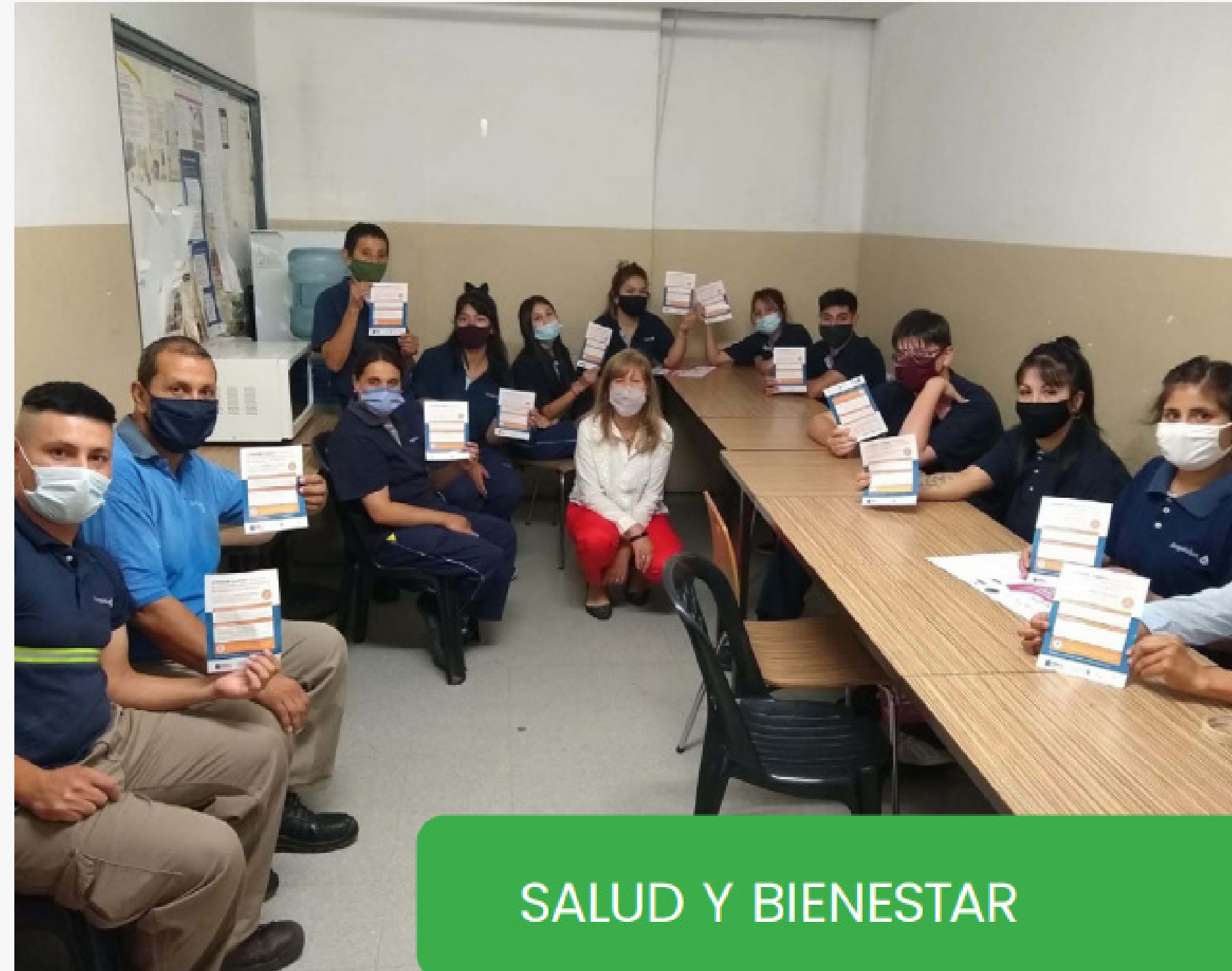
SALUD Y BIENESTAR